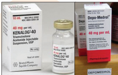
Kuva 1. Esimerkkejä kortikosteroidi-hormonipistoksista

Hormonipistoksia käytetään ortopediassa erilaisten sairauksien hoitoon ja diagnosointiin. Käytössä ovat keinotekoiset kortikosteroidihormonit (esim. Kenalog ® ja Depo-Medrol ), joita elimistö valmistaa lisämunaisten avulla. Hormoneilla on erilaisia tehtäviä elimistössä. Hoidettavalle alueelle tehtävät pistokset vähentävät tulehduksia tehokkaasti. Kortikosteroideja käytetään erilaisten nivelien, jänneiden, nivelsiteiden ja niveliä ympäröivien kudosten, limapussien ja sidekudoksen tulehdusten hoitoon sekä loukkaantumisten aiheuttamien tulehdusten ja yllirasitusoireyhtymien hoitoon. Pistokset ovat tehokkaita myös tiettyjen hermojen puristusoireyhtymien hoidossa.